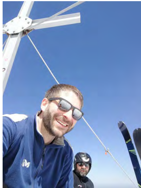
Auf dem Ötschergipfel (im Hintergrund mein Papa) bei einem meiner Hobbies, dem Schitourengehen

Feld entdeckt, in dem ich gerne tätig bin und meine Begabungen für das Reich Gottes zur Entfaltung bringen kann. Auf meinem Lebensweg gab es schon einige Stationen und es verlief auch nicht immer ganz ohne Turbulenzen, aber ich bin dankbar für diesen Weg, den Gott mich, so glaube ich zumindest, geführt hat und dankbar für die Zukunft die mich erwartet.