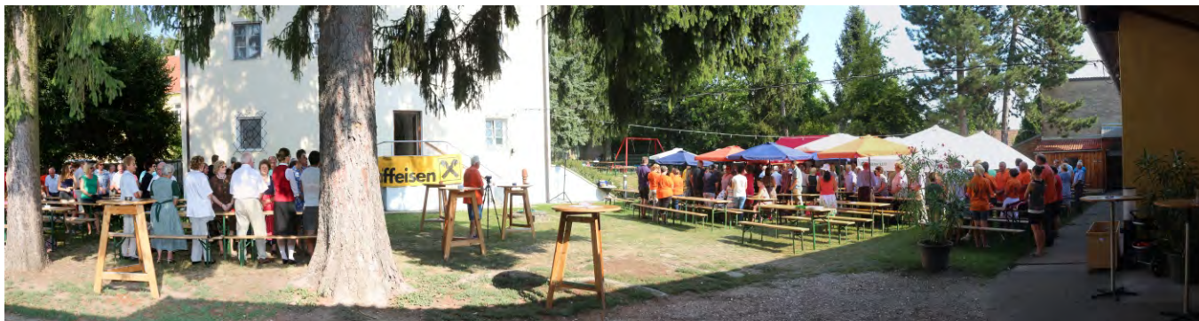
Bei kühlem Fassbier, verschiedenen Säften und Getränken, sowie bei Schnitzel, Surbraten, Grillhendl und hausgemachten Mehlspeisen feierten die zahlreichen Besucher die Jubilare - und den schönen Spätsommertag.